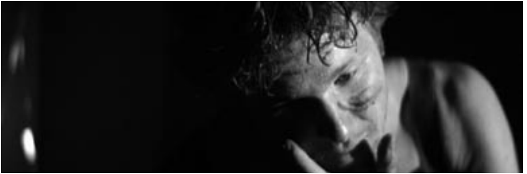
Fotos: Apocalypse Now (oben, Filmregie: Francis Ford Coppola), Mulholland Drive (nächste Doppelseite, Filmregie: David Lynch)

los. denn dazu gehören männer die überzeugungen haben. und die dennoch im stande sind ohne hemmungen ihre ursprünglichen instinkte einzusetzen um zu töten. ohne gefühl ohne leidenschaft. vor allem ohne strafgericht. ohne strafgericht. denn es ist das strafgericht das uns besiegt.