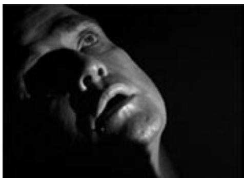
Fotos: Apocalypse Now (Filmregie: Francis Ford Coppola)